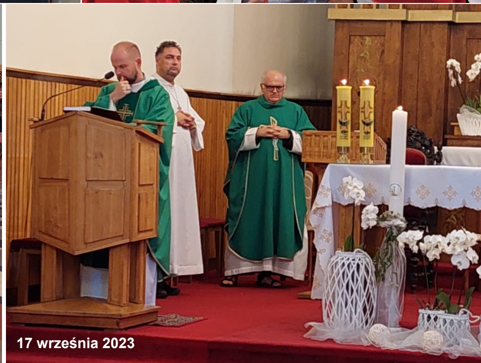
17 września 2023