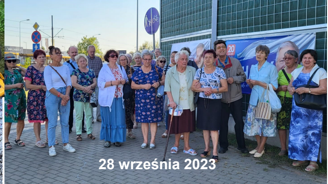
28 września 2023