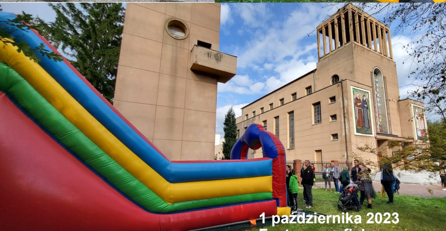
1 października 2023 Festyn parafialny