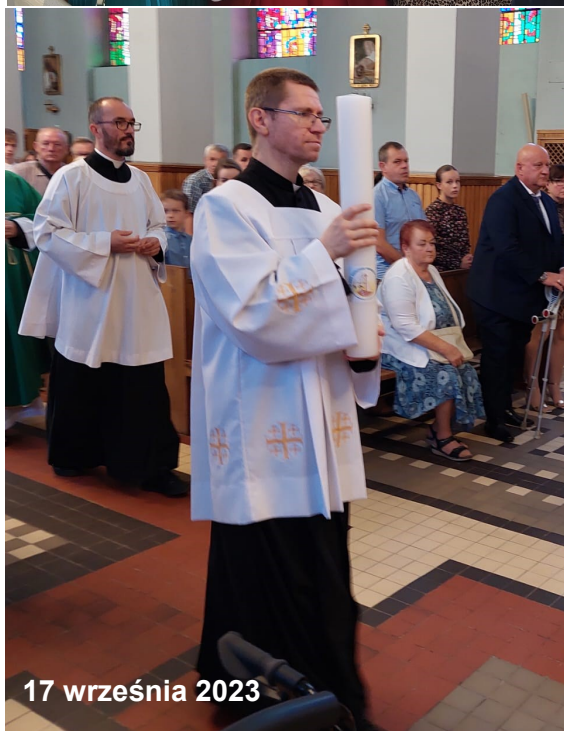
17 września 2023