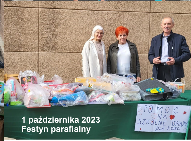
1 października 2023 Festyn parafialny