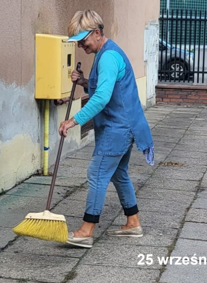
25 września 2023