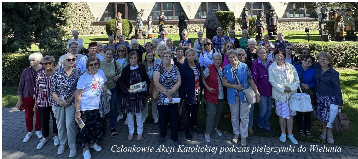
Członkowie Akcji Katolickiej podczas pielgrzymki do Wielunia