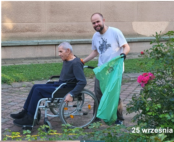
25 września 2023