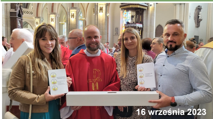
16 września 2023