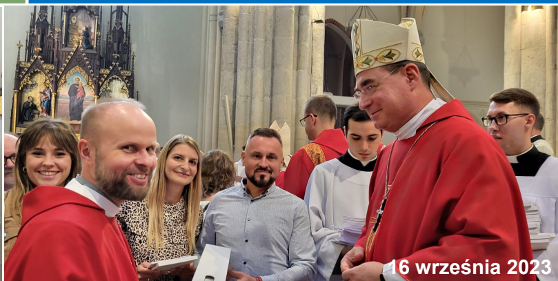
16 września 2023