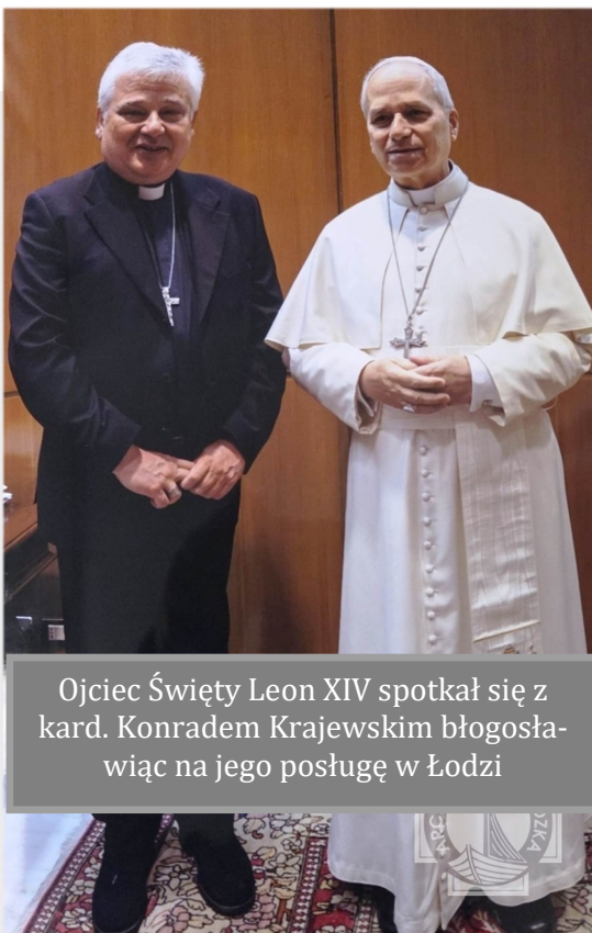
Ojciec Święty Leon XIV spotkał się z kard. Konradem Krajewskim błogosławiąc na jego posługę w Łodzi