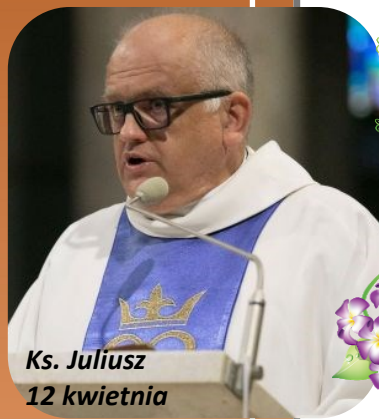
Ks. Juliusz 12 kwietnia