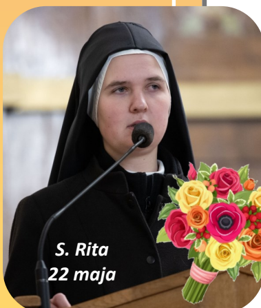
S. Rita 22 maja