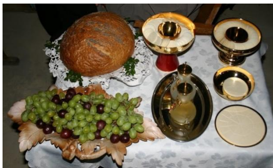
Stolik do procesji z darami

Obrzęd złożenia darów rozpoczyna się przygotowaniem ołtarza jako miejsca liturgii eucharystycznej. Na mense ołtarza umieszcza się korporał, puryfikaterz, mszał i kielich.